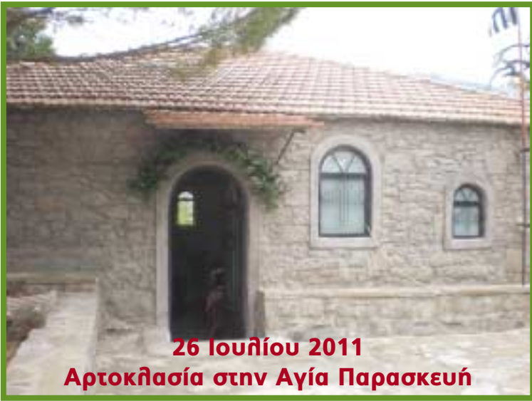
26 Ιουλίου 2011 Αρτοκλασία στην Αγία Παρασκευή